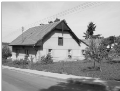
Dům čp. 17 v Koutě byl zbourán v roce 2008.