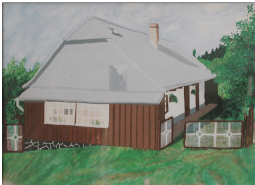
Dům čp. 82 na Vitince.