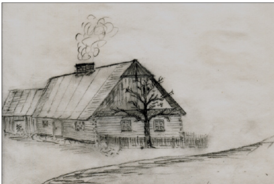
Dům čp. 22 „U Holmanů“, kreslil Josef Švandrlik, Žebrák 2009.