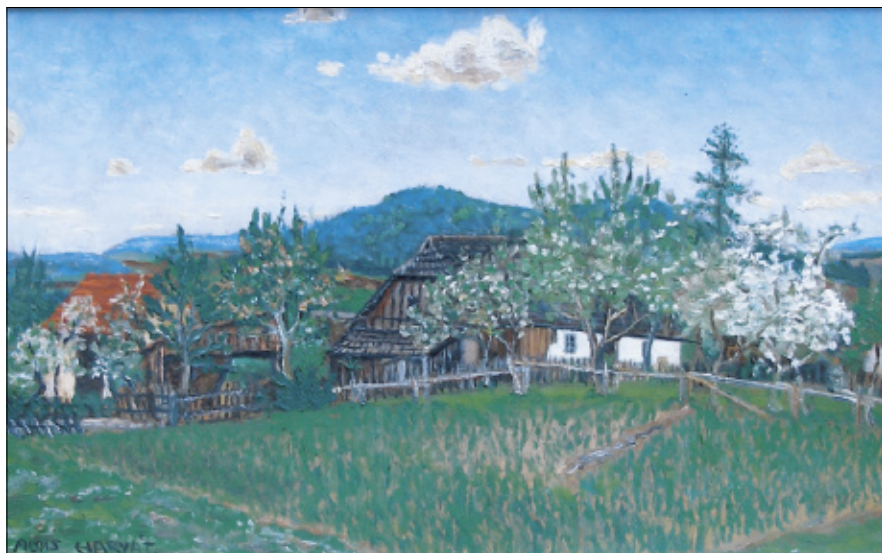
Dům čp. 42, kreslil Alois Charvát.