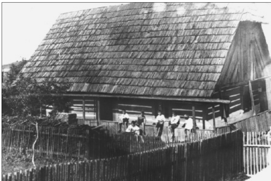
Ukázka lidové architektury Kvaň čp. 58 „U Vajnarů“.