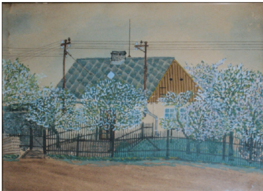
Dům čp. 96, kreslil Jan Švandrlík, 1955.