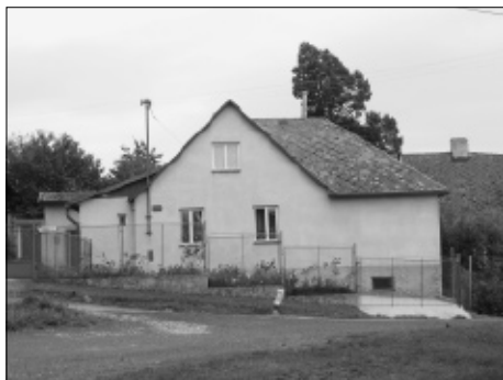
Vlevo kovárna, vpravo čp. 34.