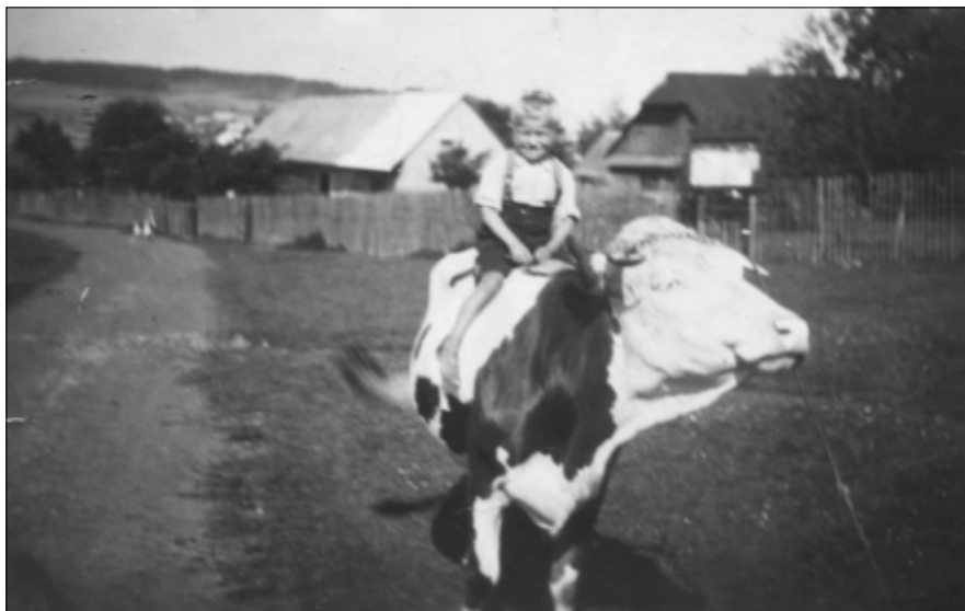
Vlevo čp. 39, vpravo čp. 8.