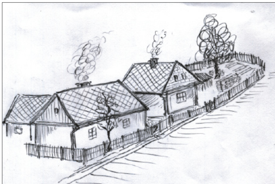
Dům čp. 43 (před zbouráním) a čp. 88 na Kvani.