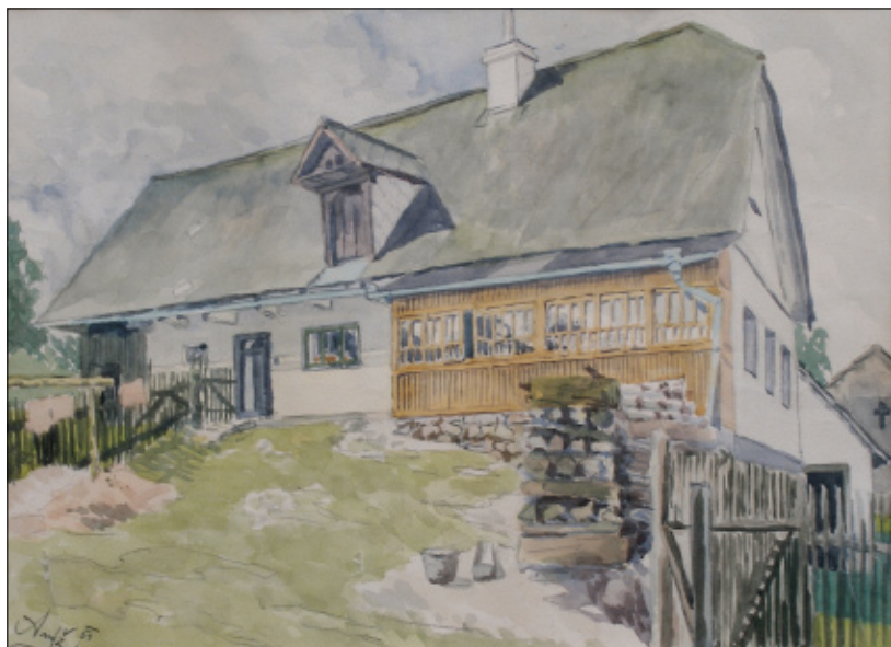
Dům čp. 74, kreslil Jaroslav Anýž, 1954.