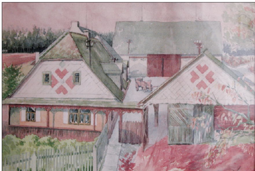
Statek čp. 28, kreslil Jaroslav Anýž, 1954.