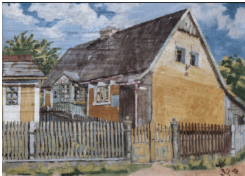
Dům čp. 53, kreslil Jaroslav Anýž, 1953.