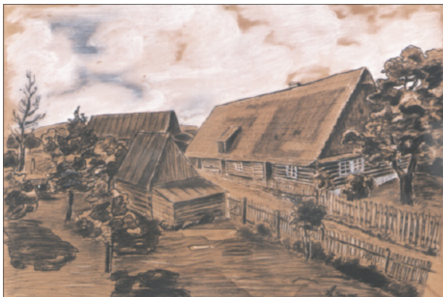
Původní podoba statku čp. 26, kreslil Jaroslav Anýž, 1952.