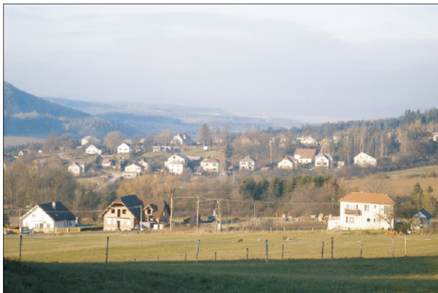
Kozojedy v roce 2006.