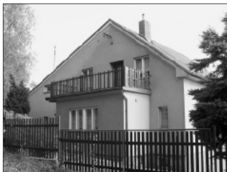
Dům čp. 11 v Kozojedech.