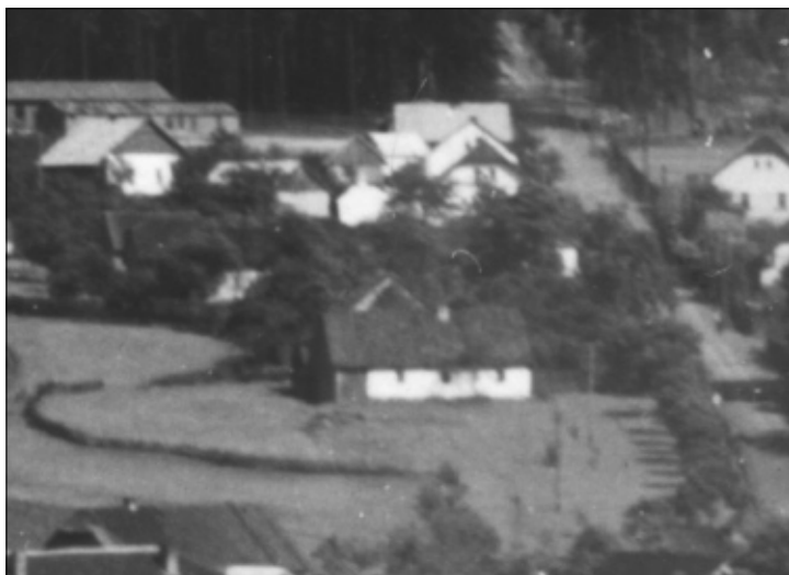
Čp. 38 v Koutě před zbouráním na pozemku čp. 43.