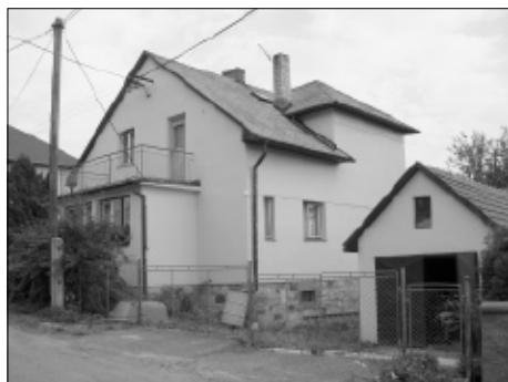
Dům čp. 22 v Kozojedech.