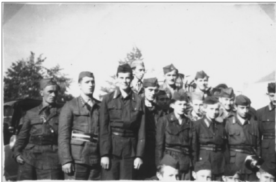
Kvaňští hasiči v roce 1953.

Po sloučení obcí Kvaň a Zaječov se v roce 1976 sloučily i požární sbory a vznikla myšlenka postavit ve středu obce novou požární zbrojnici.