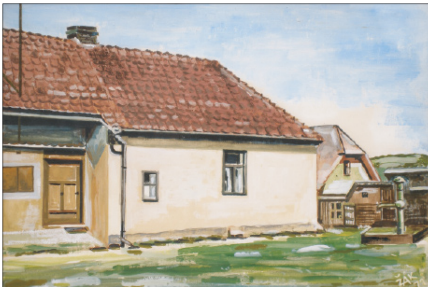
Dům čp. 15 a 14, kreslil Žák, 1971.