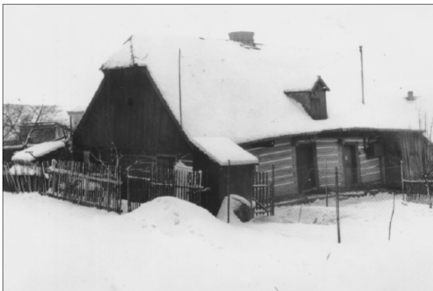
Zaniklý dům čp. 59 „U Strandů“ na Kvani.