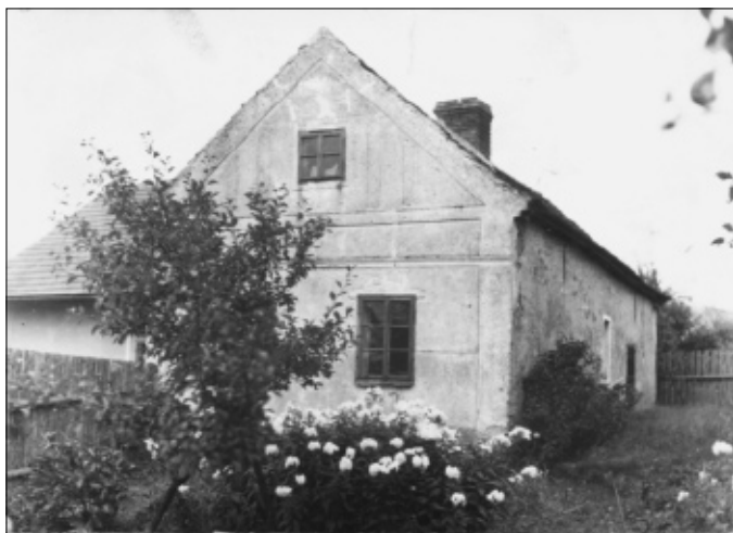
Zaniklý dům čp. 7.