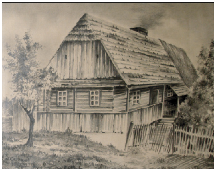
Původní stavení čp. 36 v roce 1967.