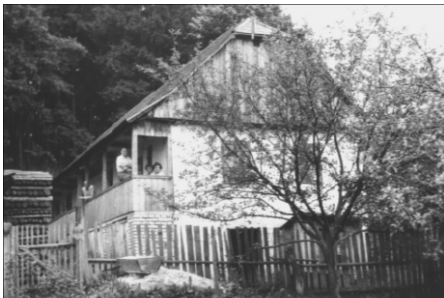
Dům čp. 90 „U Běhlávků“ v Kozojedech.