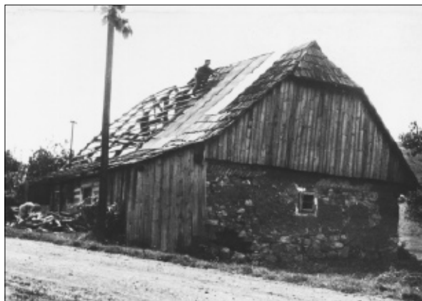
Rozebírání domu čp. 11 „u Jarošky“ na Kvani.