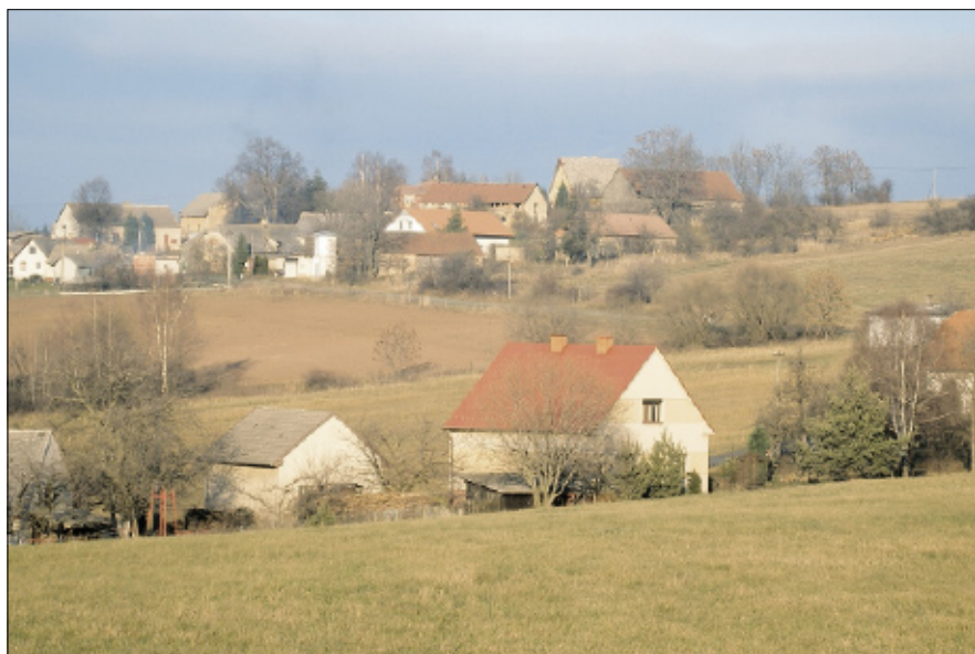
Horní Kvaň v roce 2006.