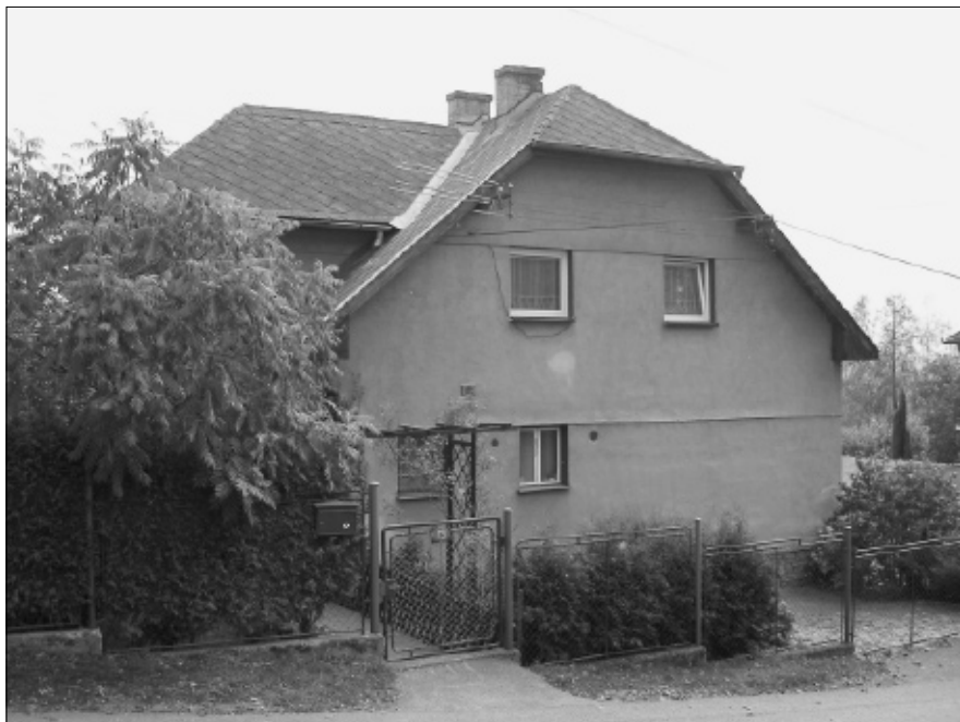
Dům čp. 13 v Kozojedech.