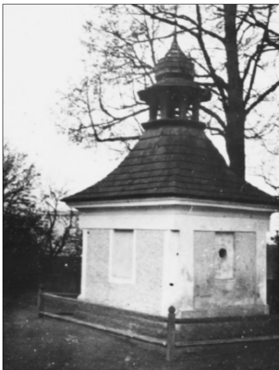
Zvonička na Kvani.