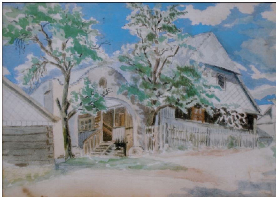
Statek čp. 41, kreslil Jaroslav Anýž.