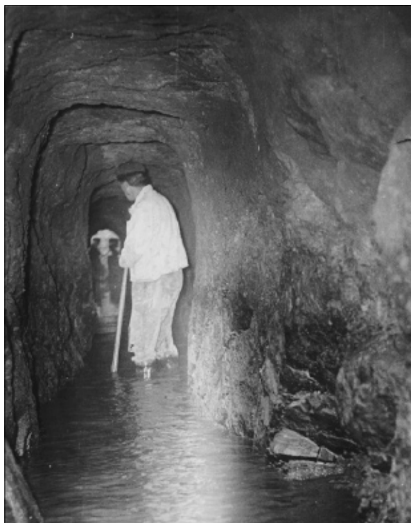
Zatopená štola „U Haldičky”.

Klásterská huť byla uzavřena v roce 1817. Zrušením této huti nastaly pro téměř sto dělníků, kteří zde pracovali, existenční starosti. Jistou záchranou byla domácí výroba cvočků a hřebíků, ale o tom později.