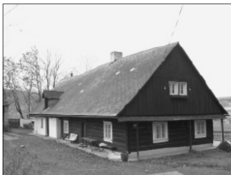
Stodola u čp. 10 a zaniklé čp. 11 (vpravo).