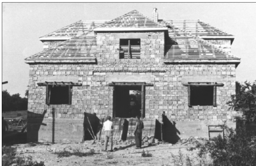
Stavba MNV Kvaň, 24. červenec 1959.