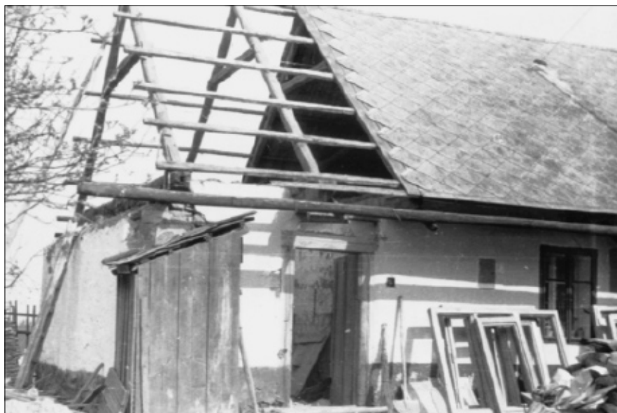
Bourání domu čp. 70 v Kozojedech „U Štichů“.