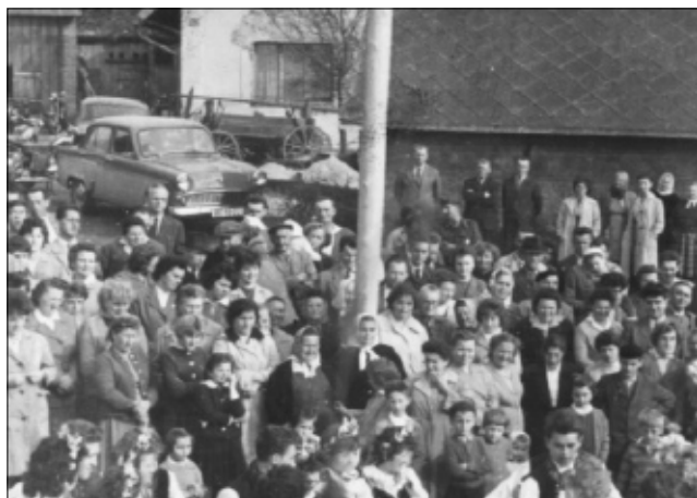
Vlevo stavení čp. 24, v popředí kovářna.