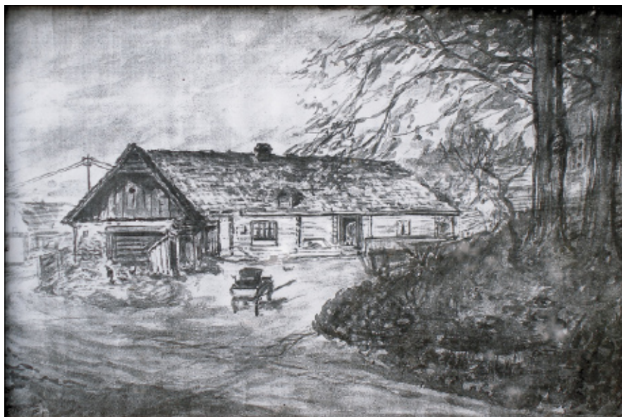
Dům čp. 23.